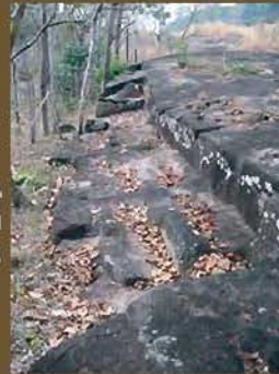
• แหล่งตัดหินในบริเวณสระตราว

• สระตราว บารายของปราสาทพระวิหารตั้งอยู่ในแนวแกนทางด้านทิศเหนือของปราสาทและเขื่อนโบราณที่มีลักษณะเป็นกำแพงหินสองชั้นที่เก่าแก่ที่สุด และมีเพียงแห่งเดียวในประเทศไทย